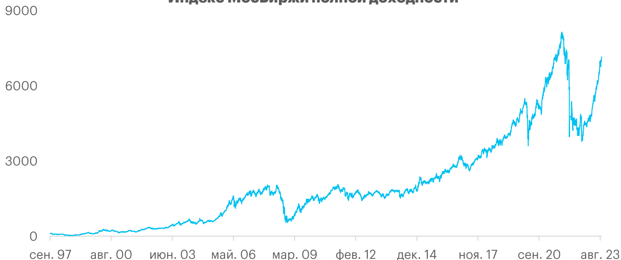
Индекс МосБиржи полной доходности

С учетом выплаченных и реинвестированных дивидендов, российский рынок акций за четверть века вырос в 71.5 раз! Среднегодовая доходность индекса составила 17.9% годовых. Это с учетом того, что на конец периода, индикатор по-прежнему примерно на 12% ниже максимальных отметок осени 21-го года (полная доходность). Таким образом, долгосрочные вложения в российский рынок акций обеспечили положительную реальную доходность, и оказались одним из лучших инструментов для сбережений, несмотря на кризисы, санкции, инфляцию и девальвацию.